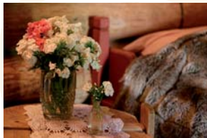
Stabburns natt i Rollag tlf: 47 34 94 44 www.stabburnsnatt.no