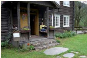
Sevletunet i Nore tlf: 97 66 56 38 www.sevletunet.no