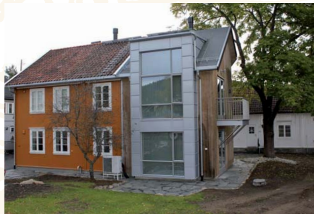
Tilbygg på eldre bygg i Dyrmyrgata på Kongsberg. Friis Arkitekter.

KI 19.00 FOREDRAG "Ny og gammel arkitektur i nytt samspill gjennom lokale eksempler" - Lampeland hotell, Flesberg Friis Arkitekter AS fra Numedal viser hvordan de jobber med stedstilpasset arkitektur og innovative løsninger. Billett: Kr. 80,- barn gratis. Kun kontant inngang og salg av kaffe og kaker.