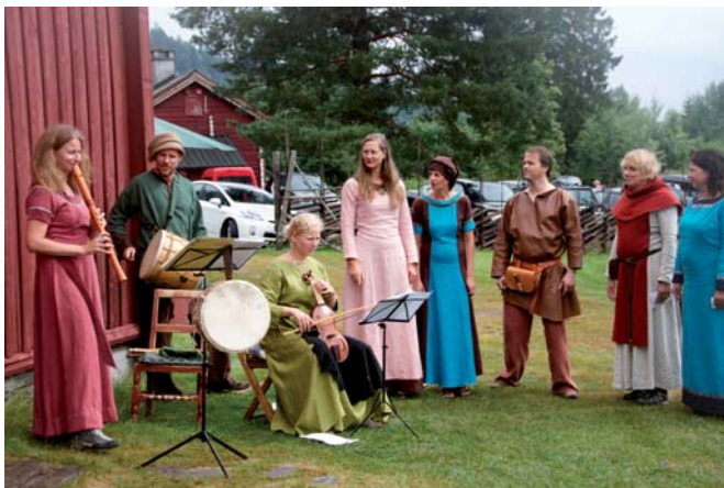
Middelalderensemblat Musicantus.

Etter en uke med middelalderverksted vises resultatene frem på bygdetunet! Salg av lokale matvarer og håndverksprodukter. Servering av retter m/inspirasjon fra vikingtid. Aktiviteter for barn. Blankvåpengruppa Vikverir og "Musicantus" opptrer! Smaksprøver av mjød og helstekt villsvin! Bueskytterkonkurranse med langbue. Inngang: voksne kr 50,- barn kr 20,- , familie: 100,-. Gratis for de som bærer middelalderdrakt. Kun kontant salg.