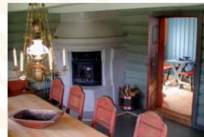
Nordre Underberget gård i Flesberg tlf: 32 76 00 25/ 90 04 05 93 www.blefjell.com