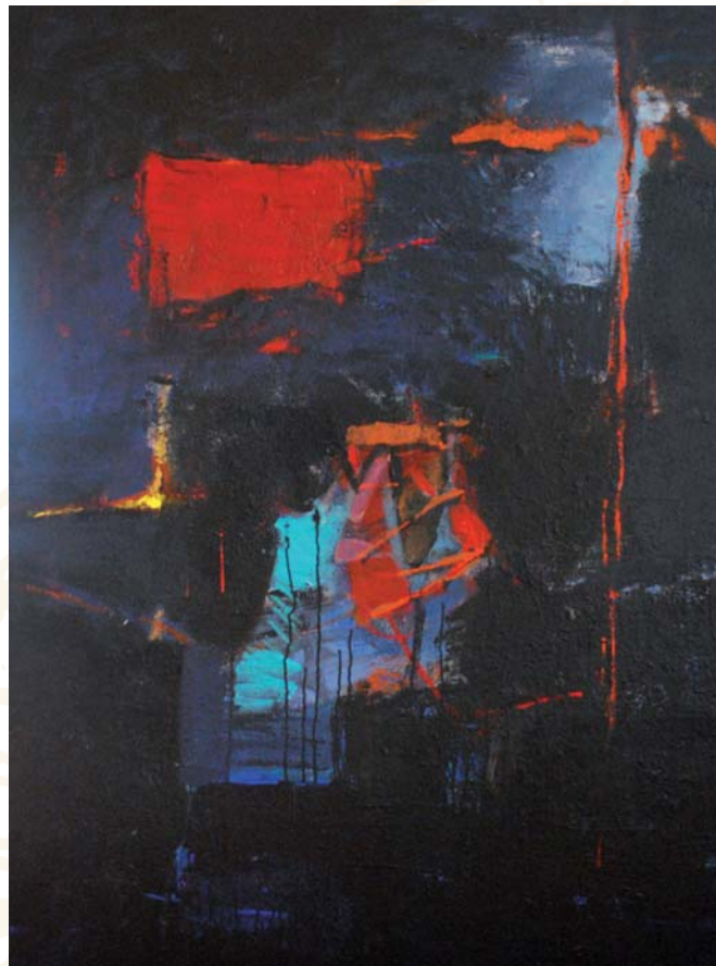
Maleri av Yngvill Lassem

Runolog K. Jonas Nordby, Runearkivet ved Kulturhistorisk museum i Oslo. I middelalderen ble bokstavene introdusert sammen med kristendommen i landet vårt. Men dette betydde på ingen måte slutten på bruken av de gamle runene. De fikk heller et oppsving i møte med den nye troen og skriften. Dette kan vi også lese av runeinnskriftene i Numedal. Inngang 80,-. Salg av kaffe og kaker.