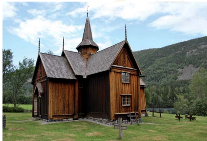
Nore stavkirke.

Kornmagasinet: "Jenters utstyrsliste før og nå".