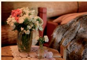
Stabbursnatt i Rollag tlf: 47 34 94 44 www.stabbursnatt.no