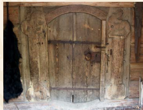
Middelalderbur på Søre Skjønne, i Nore.

Pris: 100,- kr for hele programmet. Egen bil nødvendig. Kr. 50,- ved besøk på en av gårdene.