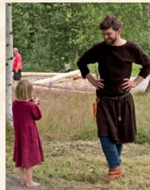
Alle foto: Kreativ Kultur.

Publikum oppfordres til å ha middelalderklær, da kommer du gratis inn!