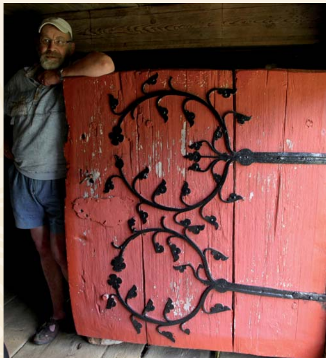
Alfstadloftet i Rollag.

Vangestadloftet i Flesberg, Alfstadloftet i Rollag og middelaldergårdene Søre Kravik og Mellom Kravik i Nore og Uvdal er åpne hver dag kl. 12.00-18.00.