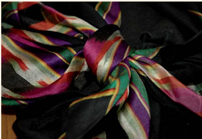
Folkedraktutstilling med "Flesbergkler" på Dåset-Flesberg bygdetun

Informasjonstavler, poster om skog, natur og kulturhistorie. 2,5 km gjennom trivelig skogsterreng. Stien er godt merket og tar 1,5-3 timer.