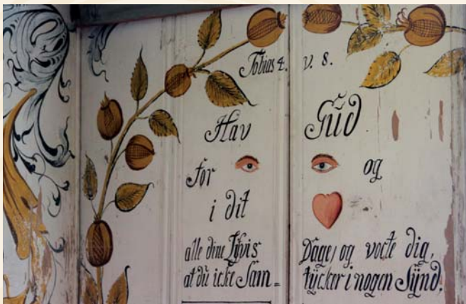
Detalj fra Nore stavkirke.