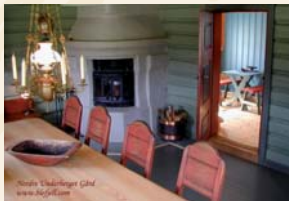
Nordre Underberget gård i Flesberg tlf: 32 76 00 25/ 90 04 05 93 www.blefjell.com