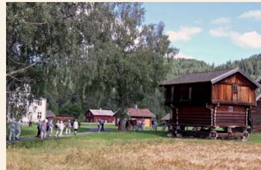
Vangestad i Flesberg.

Kl 16.00-19.00 LABROTORS DAG – Vassdragsmuseet LABRO, Kongsberg Aktivitetssdag med demonstrasjon av gamle vegmaskiner, natur- og kultursti, Maleverksted for barn. Labrokafeen, Krambua og Labro atelier er åpne. Kl 17.00 Spesialomvisning.