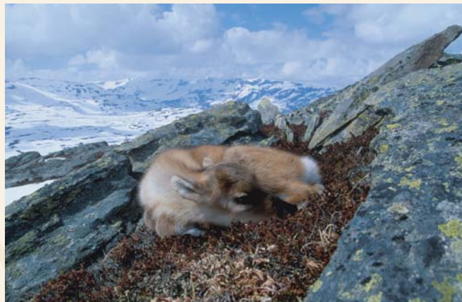
Et av Johan Bruns vakre fotografier fra Hardangervidda.

På denne turen blir det besøk til middelaldergårdene Nordre Vangestad i Flesberg, Alfstad i Rollag og Kravikgårdene i Nore i tillegg til stavkirkene i Flesberg, Rollag og Nore. Servering av lokal tradisjonskost på Sevletunet i Nore, lokale historier og sagn underveis. Buss fra Lågdamuseet, Kongsberg. Påmelding tlf: 32 73 34 68 eller post@laagdalsmuseet.no Pris kr 850,-