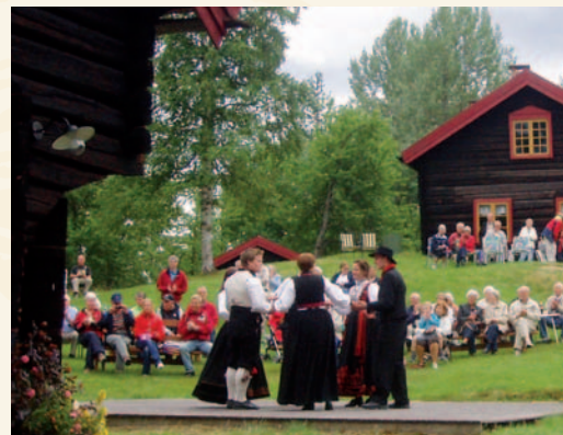
Numedal spel- og dansarlag på Dåssettunet.