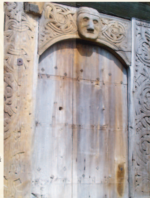
Portal på Mellom-Kravik

Opplev spennende musikk i flotte omgivelser! Bergtatt spiller rock og folkemusikk i en herlig blanding. Musikken blir unik ved bruk av gamle folkeinstrumenter pakket inn i tunge gitarer, trommer og bergtagende kvinnevokal. Bandet er et sprudlende liveband som favner et bredt publikum i alle aldre! Ta med stol, kaffesalg. Billett: Voksne kr 250,-. Barn 12-16 år kr 100,-