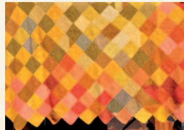
Teppe av plantefarget garn.

Billett: Kr. 200,-. Barn under 12 år, gratis.