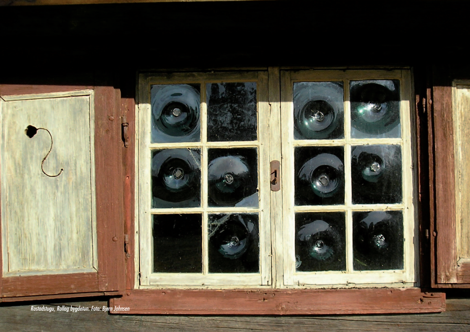
Rostadstugu, Rollag bygdeuin.