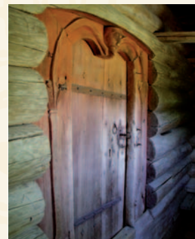
Dør på Vangestadloftet

Vangestadloftet i Flesberg, Alfstadloftet i Rollag og middelaldergårdene Søre Kravik og Mellom Kravik i Nore og Uvdal er åpne hver dag kl. 12.00-18.00.