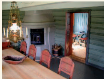
Nordre Underberget gård

Turridning kan avtales på tlf: 41 64 04 16